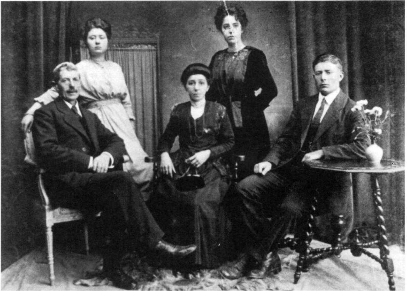
Kinderen allen geboren te Castricum: